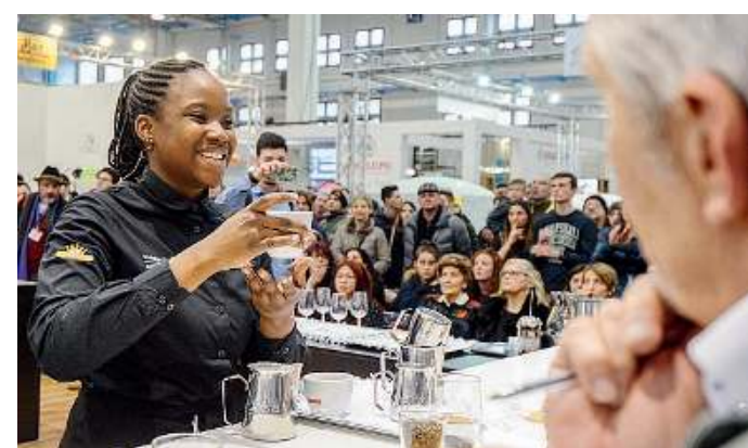
L'esibizione. La prova davanti alla giuria.

Macinatura, pulizia, dosaggio, flussaggio ed erogazione: sono alcuni dei temi della Trismoka Coffee School