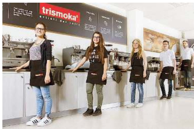
Formazione. Per arrivare alla gara un percorso specifico

Il gruppo con lei. A fare il tifo per lei, i docenti e i compagni di classe dell'istituto Serafino Riva di Sarnico, che per primi hanno creduto nelle sue abilità e l'hanno accompagnata in questa innovativa esperienza di formazione promossa da Trismoka, la torrefazione