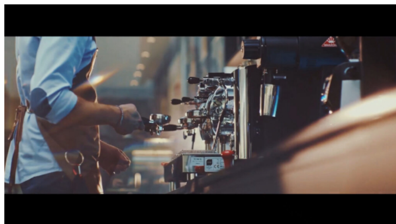
Dalla parte dei baristi

Perché l'arte di vivere, in Italia, parte da una tazza, e di questa arte Trismoka si sente, da anni, fiero interprete.