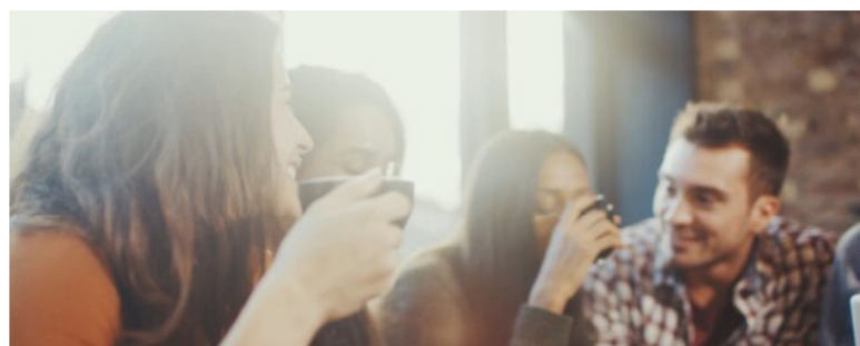
Lo spot di Trismoka

PARATICO (Brescia) – Trismoka , la torrefazione bresciana con sede a Paratico, è online da pochi giorni con un nuovo video emozionale realizzato per il web e i canali social dell'azienda dall'agenzia di marketing e comunicazione Timmage.