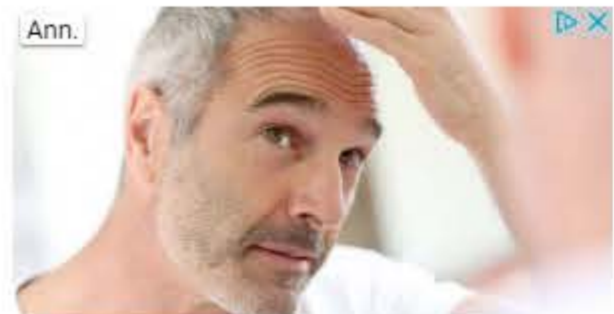
Stop alla caduta capelli - I capelli persi non ricrescono