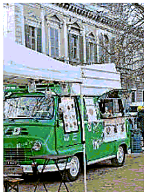
Festival. La precedente edizione