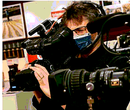
In onda. Il talent proposto da Teletutto