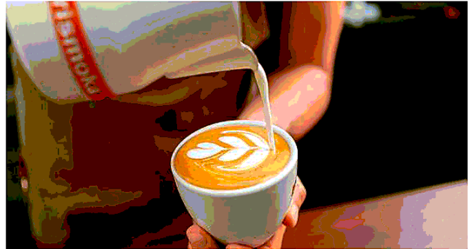
La sfida. Competenza, preparazione e voglia di mettersi in gioco