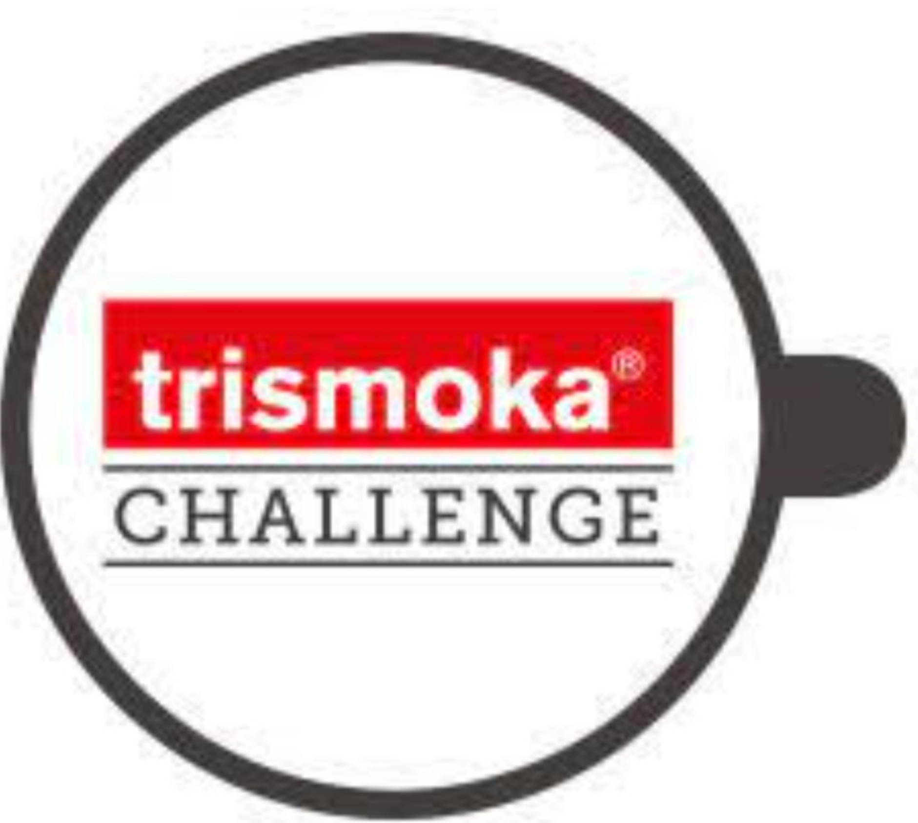
Il logo dell'evento Trismoka Challenge