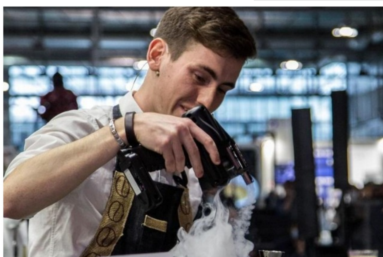
Uno dei momenti della sfida

La sfida prevedeva la preparazione di quattro espressi, quattro bevande a base di caffè e latte e quattro bevande a base di espresso analcoliche. «Ho usato due caffè diversi: uno proveniva da Panama ed era stato tostato alla Mame, l'azienda di Zurigo in cui mi occupo della formazione dei baristi , l'altro - racconta il giovane che in passato ha fatto un'esperienza biennale anche ad Amsterdam - invece era colombiano tostato al Bugan Coffee Lab di Bergamo, in cui ho lavorato tempo fa. Inoltre, per creare un legame con la piantagione del caffè, ho proposto un cocktail tropicale con riduzione di ananas e il tocco scenico della pistola che vaporizza l'aroma».