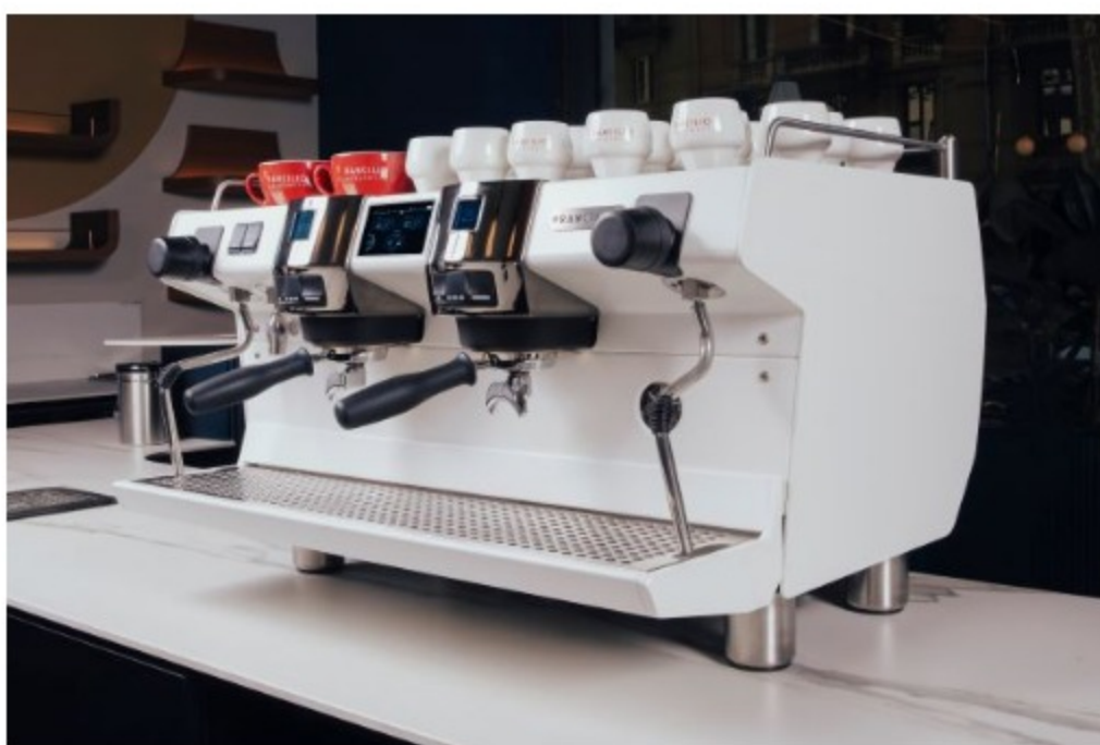
Il premio della Milano Latte Art Challenge (foto concessa)

Questo evento straordinario – il cui premio sarà proprio una macchina da caffè Invicta, firmata Rancilio Specialty – è reso possibile grazie al supporto di main sponsor di rilievo come appunto RancilioGroup e Clubhouse.