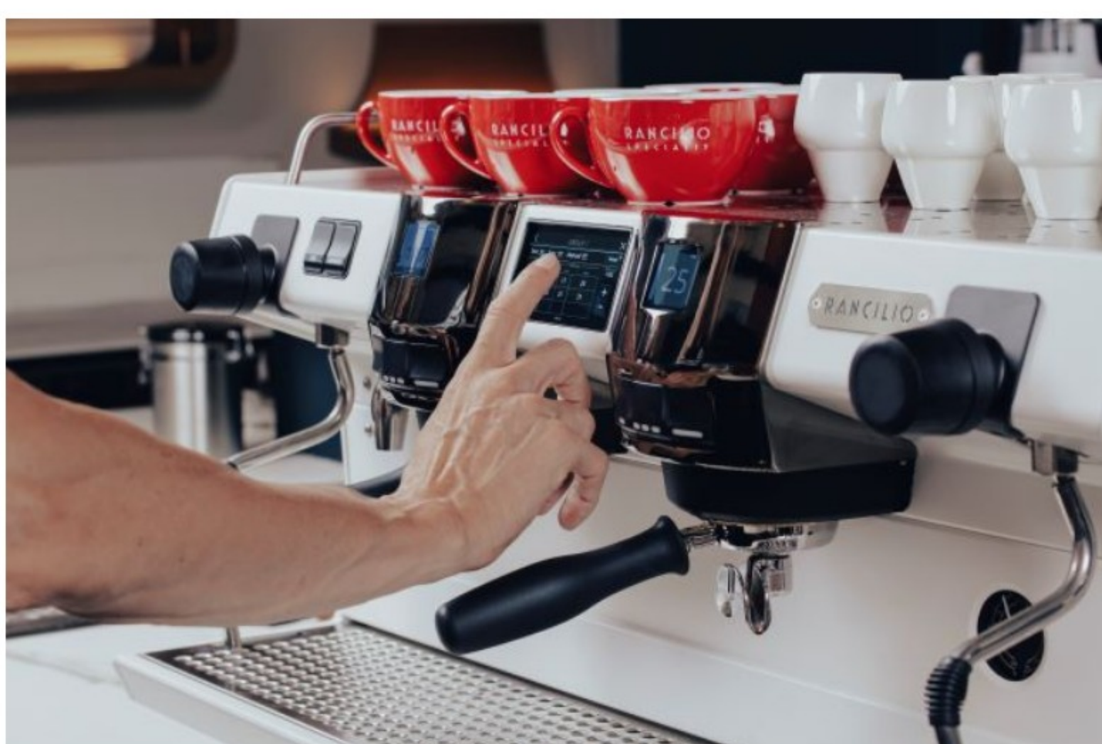
Un primo piano della Rancilio Specialty Invicta