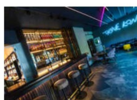
Il Drink Kong e gli altri bar italiani sul tetto del mondo