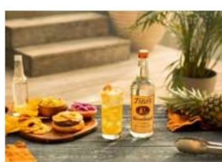
Tito's for Dogs, l'iniziativa di Tito's Vodka per migliorare la vita dei cani