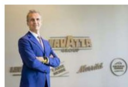
Lavazza, crescono i volumi e il fatturato