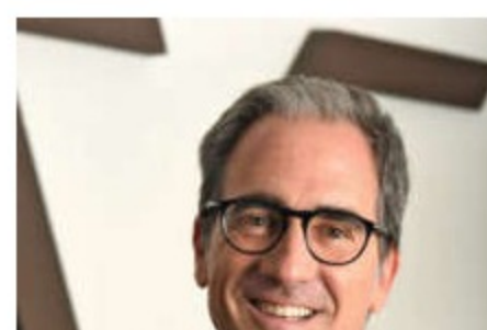
Volcafe Italia, servizio su misura per il torrefattore