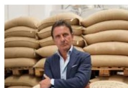
#iofacciodipiù Costadoro ottiene la certificazione B Corporation