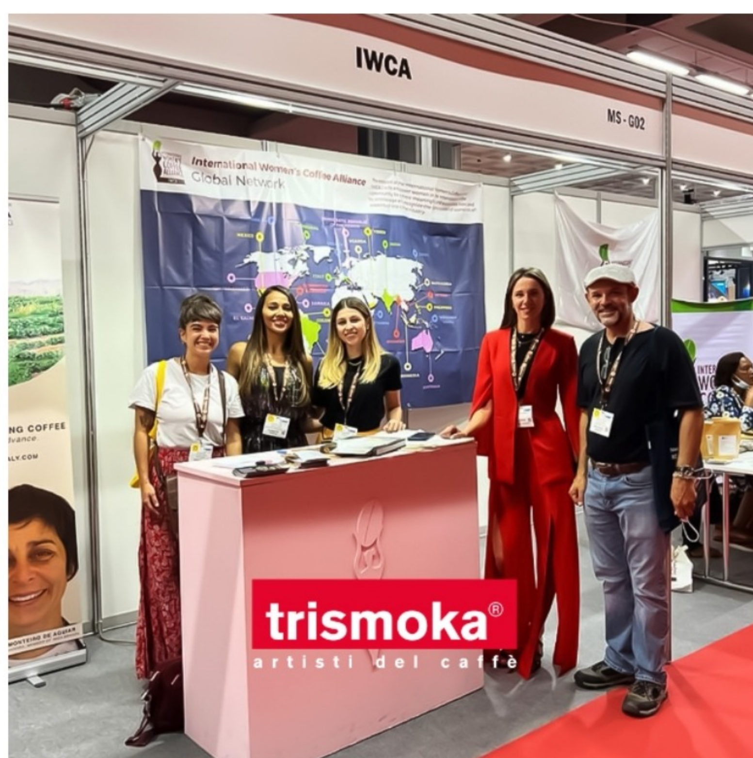
Trismoka presenta in collaborazione con l'associazione Iwca Italia, Miss Moka (immagine concessa)