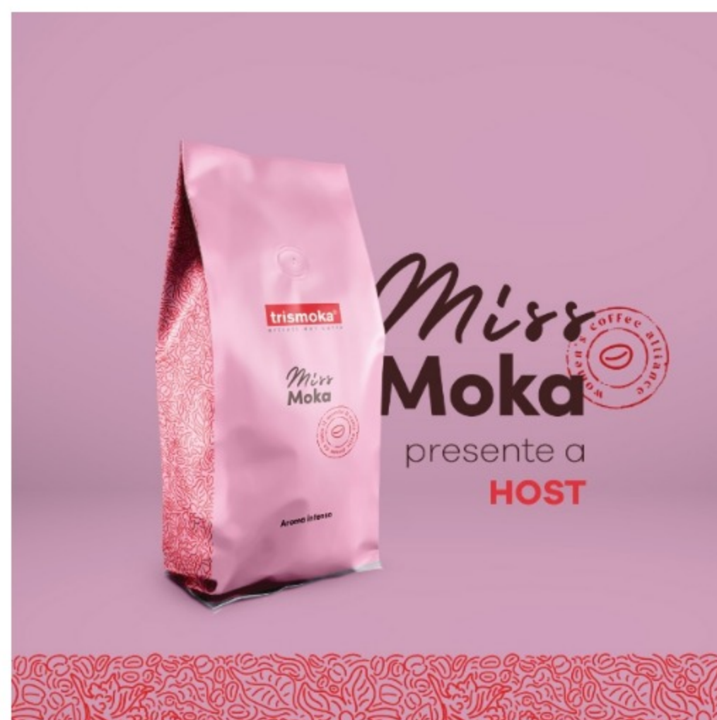
Miss Moka a Host Milano

Iwca Italia è l'associazione italiana affiliata all' International women's coffee alliance , un'organizzazione globale dedicata a sostenere le donne lungo l'intera filiera di produzione del caffè. Rappresenta, dunque, le donne coinvolte nell'industria del caffè e lavora per migliorare le loro condizioni di vita.